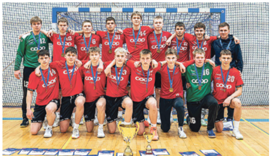
U 19 Eesti meister 2026 – Põlva Spordikooli U19 käsipallimeeskond.