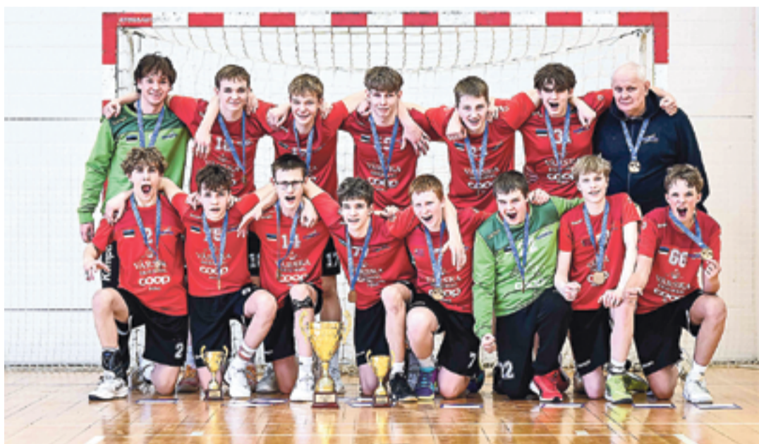
U 16 Eesti meister 2026 – Põlva Spordikooli U16 käsipallimeeskond.